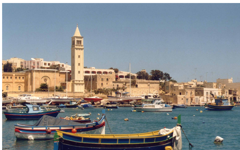
La ville de Malte